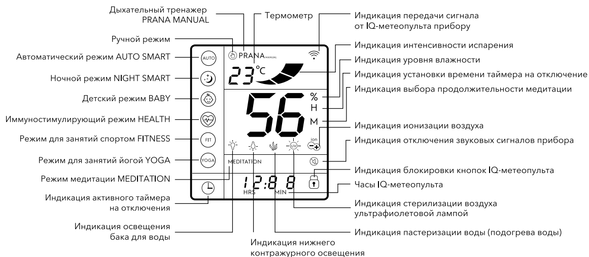
Рис.3 Дисплей IQ-метеопульта