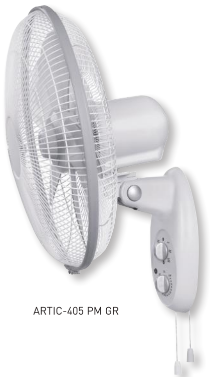
ARTIC-405 PM GR