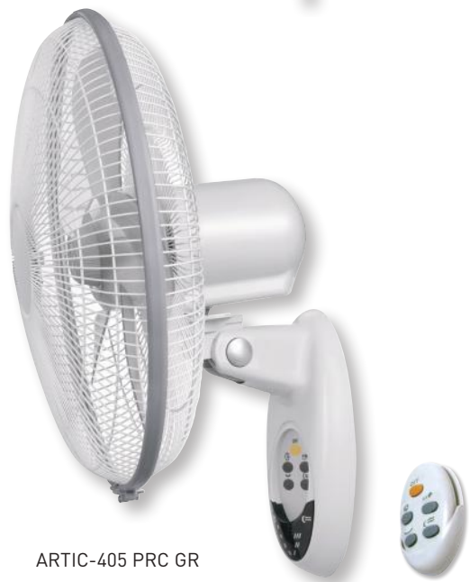
ARTIC-405 PRC GR

Настенные вентиляторы ARTIC PM/PRC GR обладают низким уровнем шума, имеют три скорости вращения и таймер.