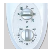
Artic 405 PM GR Переключатель скоростей и таймер.