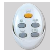
Artic-405 PRC GR Дистанционный пульт управления.