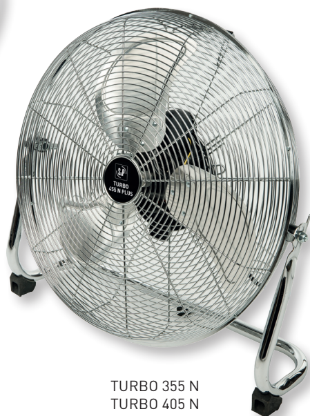
TURBO 355 N TURBO 405 N TURBO 455 N PLUS

Вентиляторы серии TURBO-N обладают высокой производительностью и предназначены для использования в общественных и промышленных помещениях. Доступны три модели для напольной установки с диаметром крыльчатки 360, 400 и 450 мм и одна модель на телескопической ножке с диаметром 450 мм. Вентиляторы комплектуются 3-х скоростными электродвигателями с защитой от перегрева и ручкой для переноски.