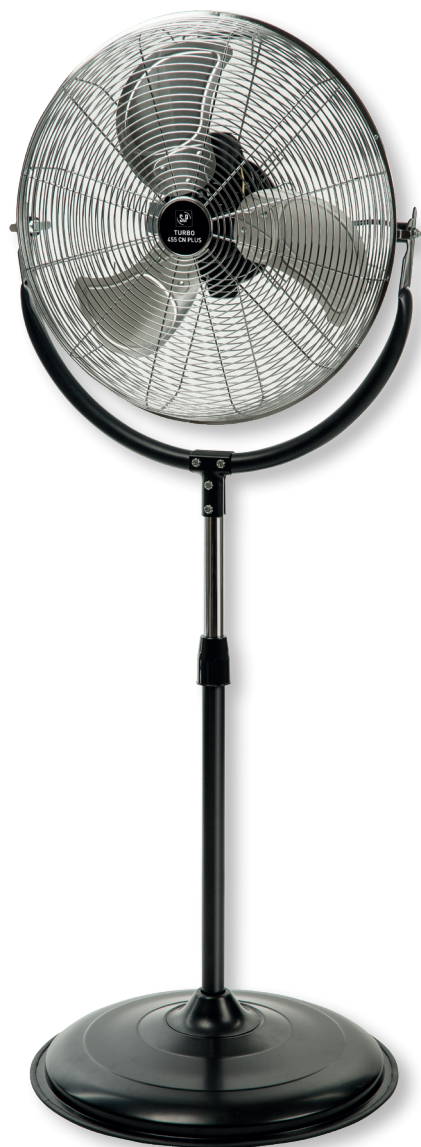
TURBO-455 CN PLUS