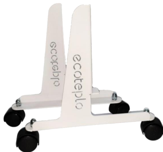
До AIR, LION Series