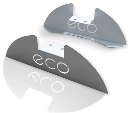
До ECO Series