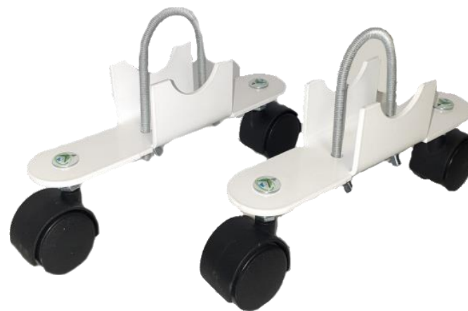
До электрорадіаторів ELITE