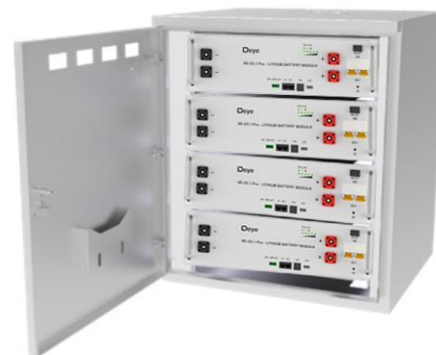
Встановлення в стійку