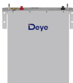
Встановлення на стіну